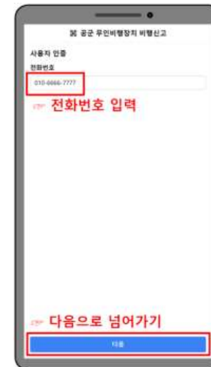
다. 전화번호 입력