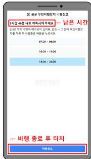
가. 비행 中