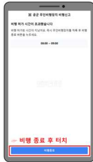
나. 비행 허가시간 초과