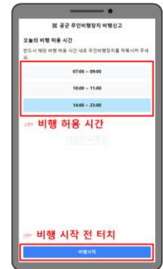
라. 비행 시작 前