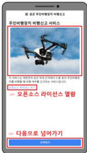
가. 메인 페이지